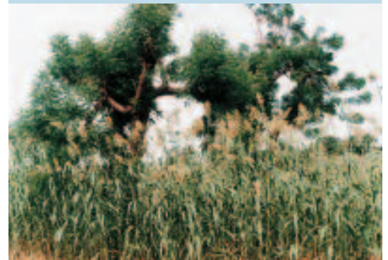
Photo 6. Bon développement végétatif du sorgho sous le neem taillé. A healthy sorghum crop growing under pruned neem trees.