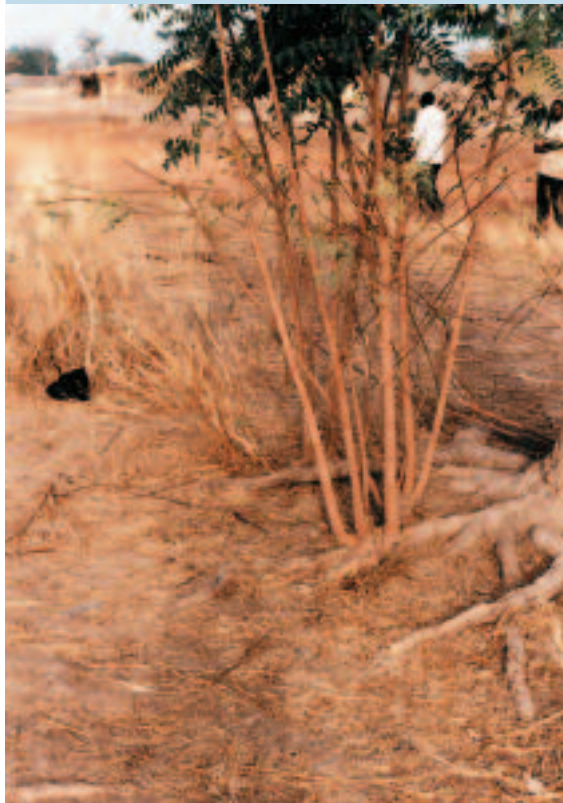
Photo 9. Régénération du neem par drageonnage. Neems regenerating from root shoots.