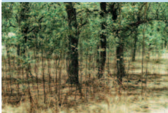
Photo 10. Pour minimiser les coûts de production de plants, les paysans ont appris à transplanter les semis naturels. To reduce the cost of producing neem seedlings, farmers have learned to transplant naturally seeded plants.