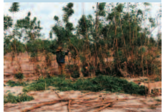
Photo 7. Le neem est une importante source de biomasse et de bois dans la région du Boulkiemdé. The neem is an important source of biomass and timber in the Boulkiemdé region.