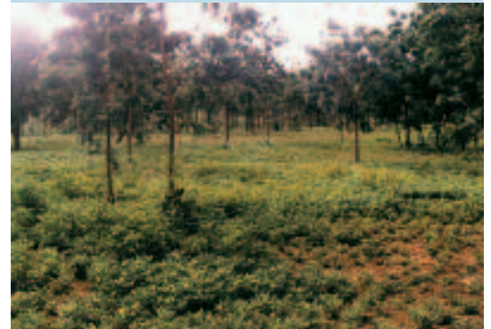
Photo 5. Bon développement végétatif de l'arachide sous les houppiers du neem. A healthy groundnut crop growing under neem crowns.

Le neem a été introduit dans la province du Boulkiemdé avant l'indépendance par les missionnaires blancs. Le parc à neem est l'exemple typique de parcs construits pour répondre à des préoccupations spécifiques. Celles-ci influencent naturellement la distribution spatiale de ces parcs dans le terroir villageois. La présence du neem dans les champs de village permet de disposer facilement de bois pour la cuisine et de feuilles pour soigner les enfants. Cela est particulièrement important dans les pays sahéliens, où la pharmacopée traditionnelle est encore vivace et où le problème du bois (de chauffe et de construction) se pose avec acuité. L'influence du neem sur les cultures associées comme le mil et le sorgho est étroitement liée au mode de gestion de l'arbre. L'émondage et l'élagage permettent de réduire l'ombrage et l'encombrement qui gênent les cultures. L'étude a mis en évidence le rôle des connaissances endogènes dans l'adoption et la diffusion des espèces ligneuses introduites.