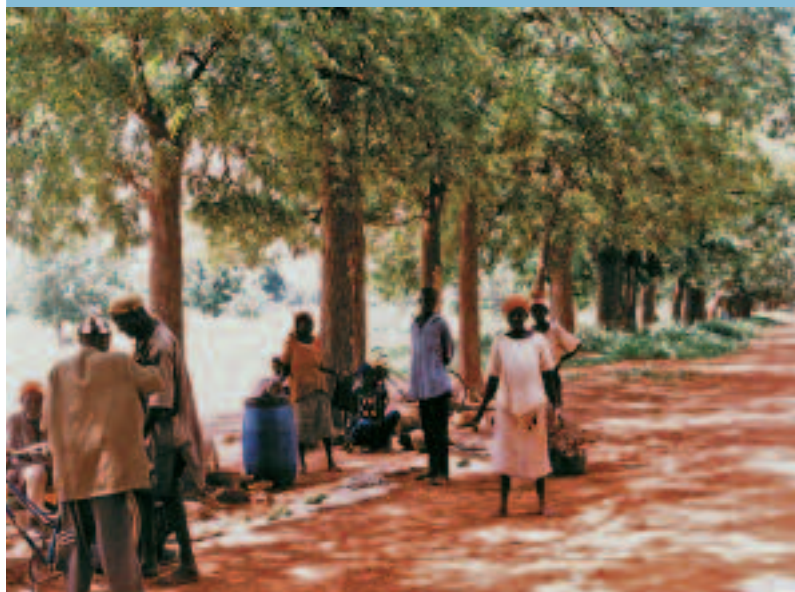
Photo 2. Plantation de neems le long d'une route, dans le département de Kindi (plantation âgée de 46 ans). Roadside plantation of neem trees (46 years old), in the département of Kindi.