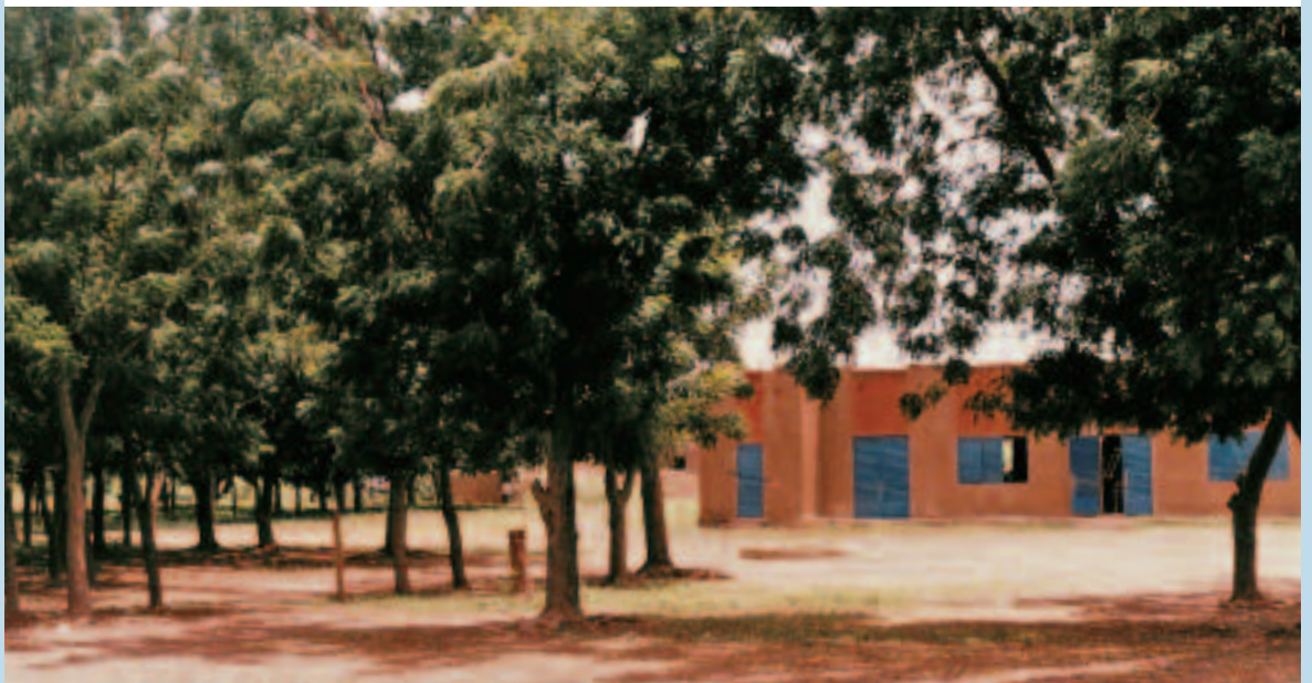
Photo 1. Plantation du neem pour l'ombrage, dans la cour d'une école primaire. Plantation of neem trees for shade in a primary school playground.